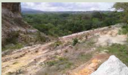
Διοξειδίο του πυριτίου Φυσικό κοίτασμα

Προκαλεί ισχυρή αφυδάτωση σε όλα τα έντομα που έρχονται σε επαφή με το προϊόν.